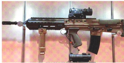
Modernisiertes Sturmgewehr L85A3 für die britische Armee.

Die British Army modernisiert ihre Handwaffen. So soll das SA80A3 bzw. L85A3 demnächst an die gesamte Truppe kom-