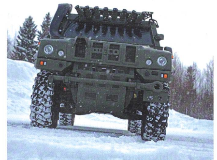
Letzte Tranche des LAV für Norwegen.