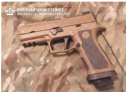
SIG P320 X-Carry für dänische Armee.

Die SIG P320 durchlief mit drei weiteren Waffen ein mehrwöchiges Auswahlverfahren, in dem taktische Handhabung, Treffsicherheit, Zuverlässigkeit und Ergo-