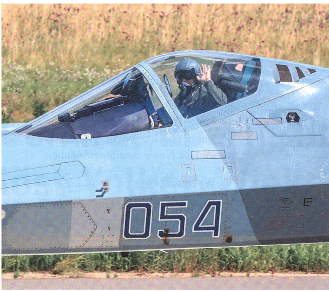
Unerwartet gab die russische Luftwaffe diese Nahaufnahme des Su-57 frei. Sie zeigt das Cockpit des sagenumwobenen Suchoi-T-50 von nahe. Die kantig blau-weiss aufgetragene Nummer 054 entspricht den Gepflogenheiten der Luftwaffe und könnte bestätigen, dass Russland seinen Stolz, den Stealth-Jet Su-57 (temporär?), in Betrieb genommen hat.