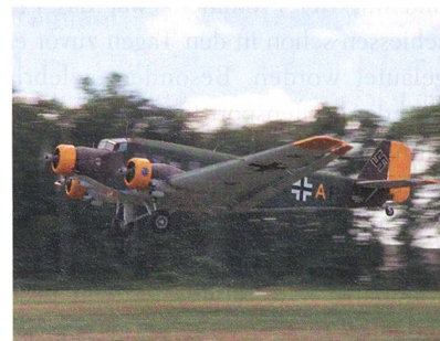
Ju-52/3m aus dem Zweiten Weltkrieg.

Dort werden die Schwerverwundeten ausgeladen, einer überlebte den Flug nicht. Ich verabschiedete mich vom Ju-52-Piloten und Lebensretter.» oex.