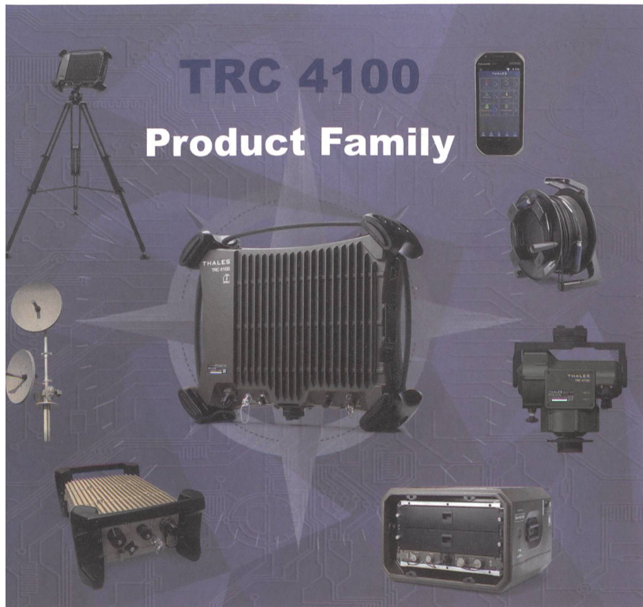
Die TRC 4100-Produktfamilie von Thales.