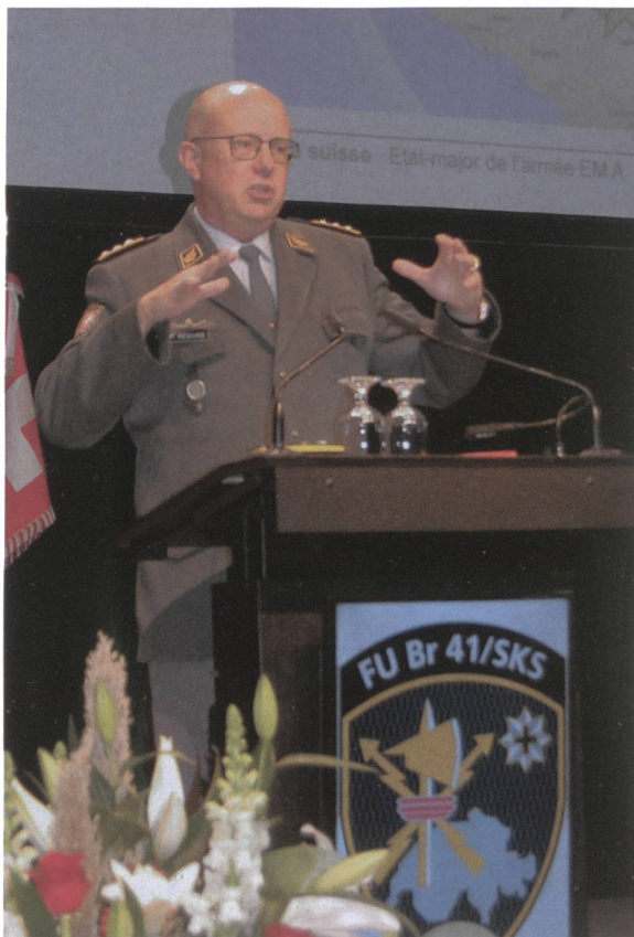
Der Chef der Armee spricht zur FU Brigade.