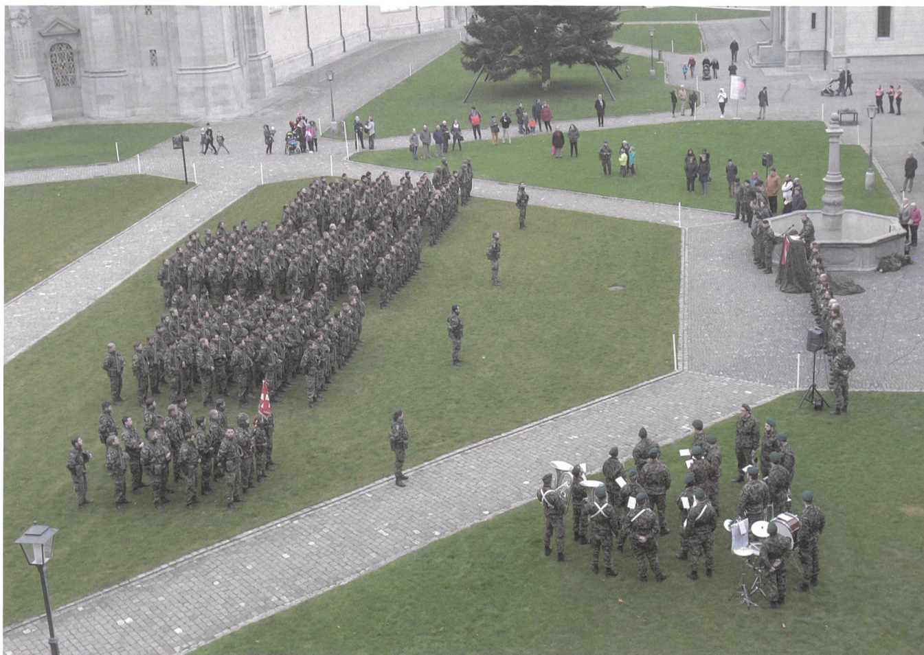
Das Bataillon ist zur Fahnenabgabe angetreten.

Gori: Gefallen hat mir, dass sobald die Kompanien und der Stab Betriebstemperatur erreicht haben, die Leistung der Miliz beträchtlich sind. Es hat mir sehr viel Freude bereitet, den Einsatz- und Leistungswillen sowie die Kreativität der Kader und der Soldaten bei der Ausbildung und während der Übung zu sehen.