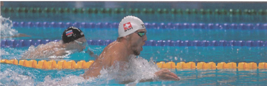
Und als Schwimmer erfolgreich.