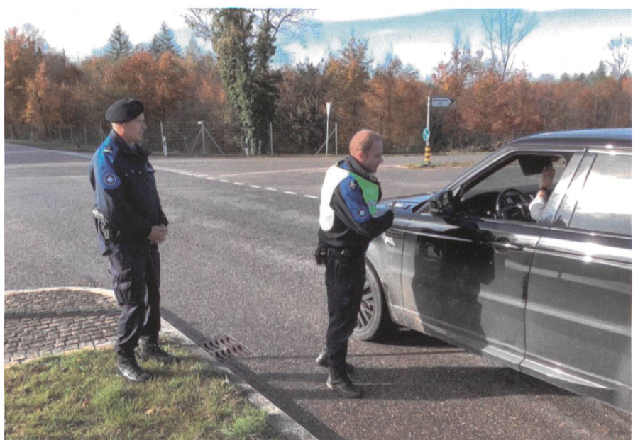
Die Vorselektion ist entscheidend. Dafür braucht es Erfahrung und Menschenkenntnis.