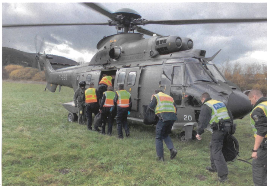
Die Beamten verschieben per Lufttransport.

Angefangen hat diese Methode in der Schweiz 2009 nach einem Arbeitsbesuch des Grenzwachtkommandanten in Ostdeutschland. Es wurden aber helvetische Anpassungen am Konzept vorgenommen, wie die Kombination von heliportierten und terrestrischen Mitteln. Die Rhein- und Bodenseegrenze und das Engadin eignen