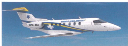
Pilatus PC-24 als Ambulanzflugzeug.

Die Schwedische Rettungsflugorganisation KSA hat sich für den Kauf von sechs Pilatus PC-24 in vollständig ausgerüsteter Ambulanzkonfiguration entschieden. Die PC-24 werden ab 2021 die flugmedizinische Versorgung in ganz Schweden ermöglichen. Die 21 Provinzen Schwedens haben sich zur