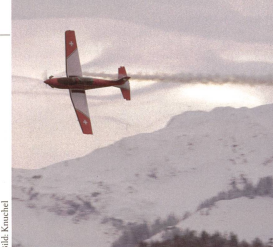
Der PC-7 gehört zu den bewährten Trainingsflugzeugen der Luftwaffe.

Aufgrund der Radaraufzeichnungen kann mit Sicherheit gesagt werden, dass der Pilot das Flugzeug in den letzten rund 90 Sekunden vor der Kollision mit dem Autopiloten im Horizontalflug auf einer Höhe von 3962 m ü. M. steuerte. In der Folge geriet das Flugzeug in eine ausweglose Situation. Es ist davon auszugehen, dass der Pilot während des ganzen Fluges bis zum Unfall nach Sichtflugregeln flog.