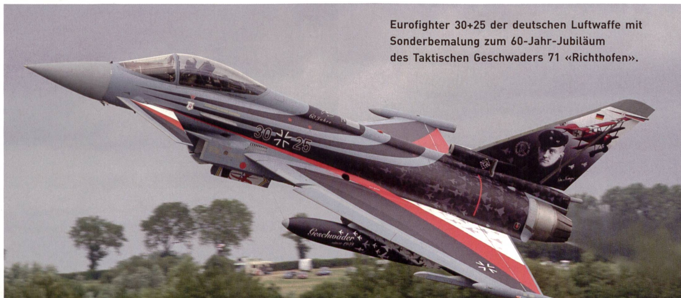
Eurofighter 30+25 der deutschen Luftwaffe mit Sonderbemalung zum 60-Jahr-Jubiläum des Taktischen Geschwaders 71 «Richthofen».