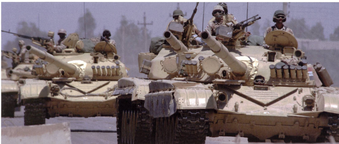
Panzer T-72 Ural, irakische 6. Pz Div «Medina», südlich Nasiriyah, März 2003.

101. Luftlande Div auf die «Medina» Division schlug fehl.