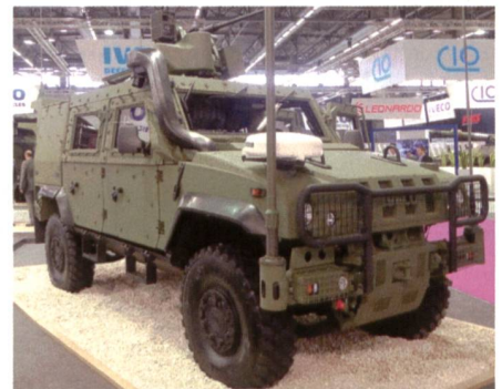
Grossbestellung von Iveco LMV.

Die niederländische Beschaffungsorganisation DMO hat die Beschaffung von bis zu 1275 IVECO Light Multirole Vehicle