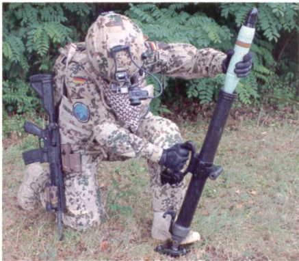
Neuer leichter Minenwerfer RSG60.

Die Bodenplatte besteht aus einem Kohlefaserverbundwerkstoff. Das neuartige Design der Waffe spart Platz und ermöglicht es den Nutzern, den Mörser in wenigen Sekunden aus der Transportstel-