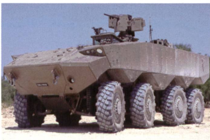
Neuer Radschützenpanzer Eitan APC mit Iron Fist Selbstschutzsystem.

Iron Fist ist ein abstandsaktives Hardkill-Schutzsystem für Landfahrzeuge des Herstellers Israel Military Industries (IMI), welches mittlerweile von Elbit Systems übernommen wurde. Die IFLD setzt un-