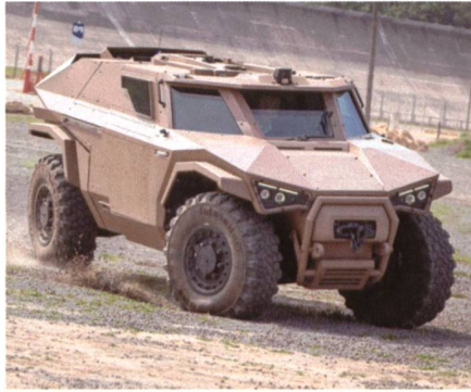
Hybridangetrieben: Scarabée Arqus.

Arqus hat das Aufklärungs- und Erkundungsfahrzeug Scarabée anlässlich der Paris Air Show zum ersten Mal öffentlich präsentiert. Das leichte, gepanzerte 4x4-Fahr-