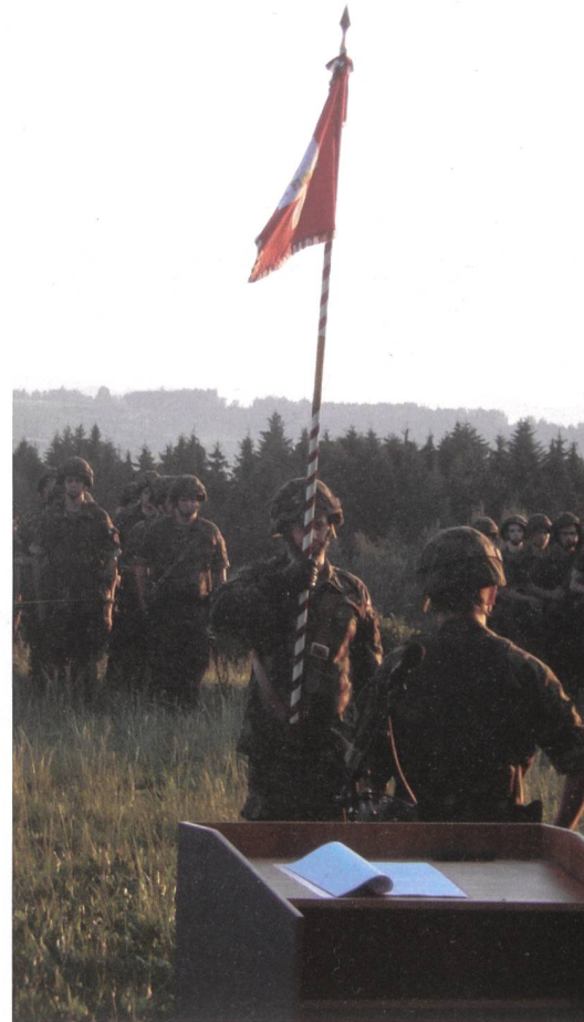
Die Standarte der M Flab Abt 34 .