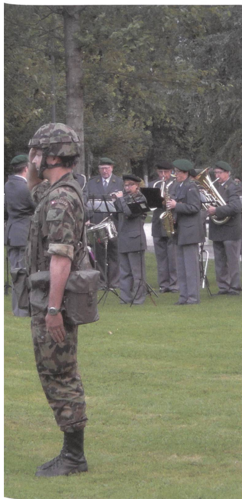
Guisan-Wiese am Lido der Stadt Luzern.

versammlung zum General gewählt – ein militärischer Dienstgrad, den es in der Armee in Friedenszeiten nicht gibt.