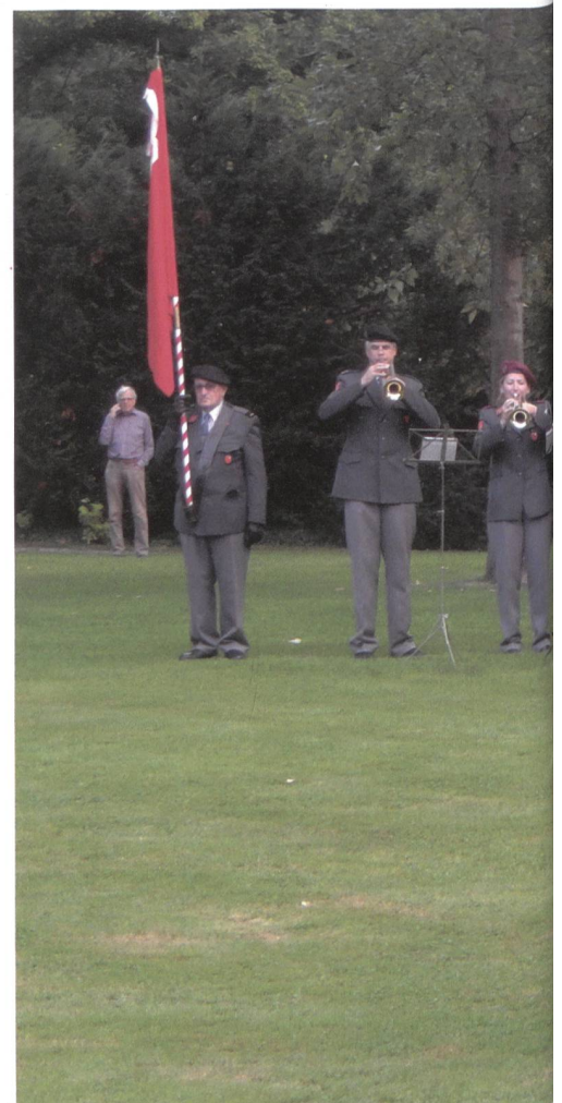
Feierliche Standartenrückgabe auf der General