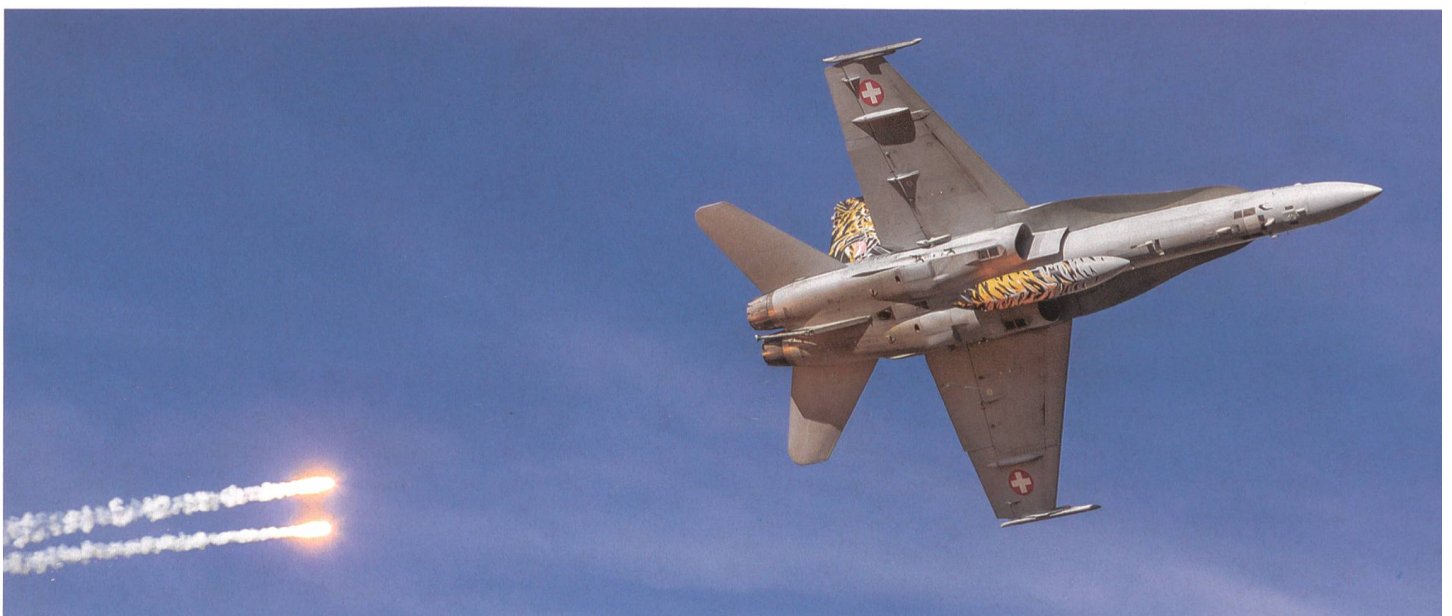
Die Staffelmaschine J-5007 der Fliegerstaffel 11 stösst über der Axalp zum Eigenschutz zwei Flares (Täuschkörper) aus.