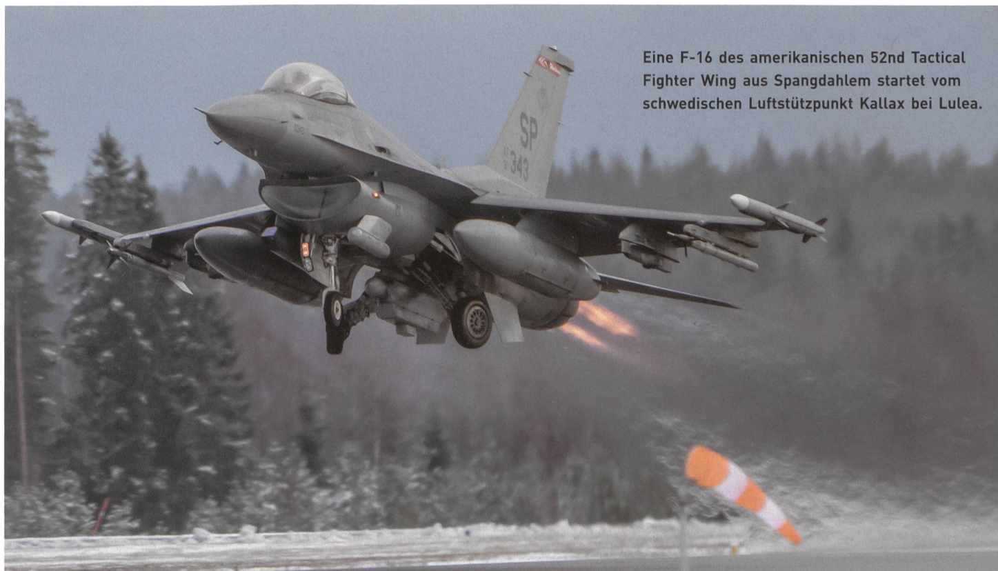
Eine F-16 des amerikanischen 52nd Tactical Fighter Wing aus Spangdahlem startet vom schwedischen Luftstützpunkt Kallax bei Lulea.