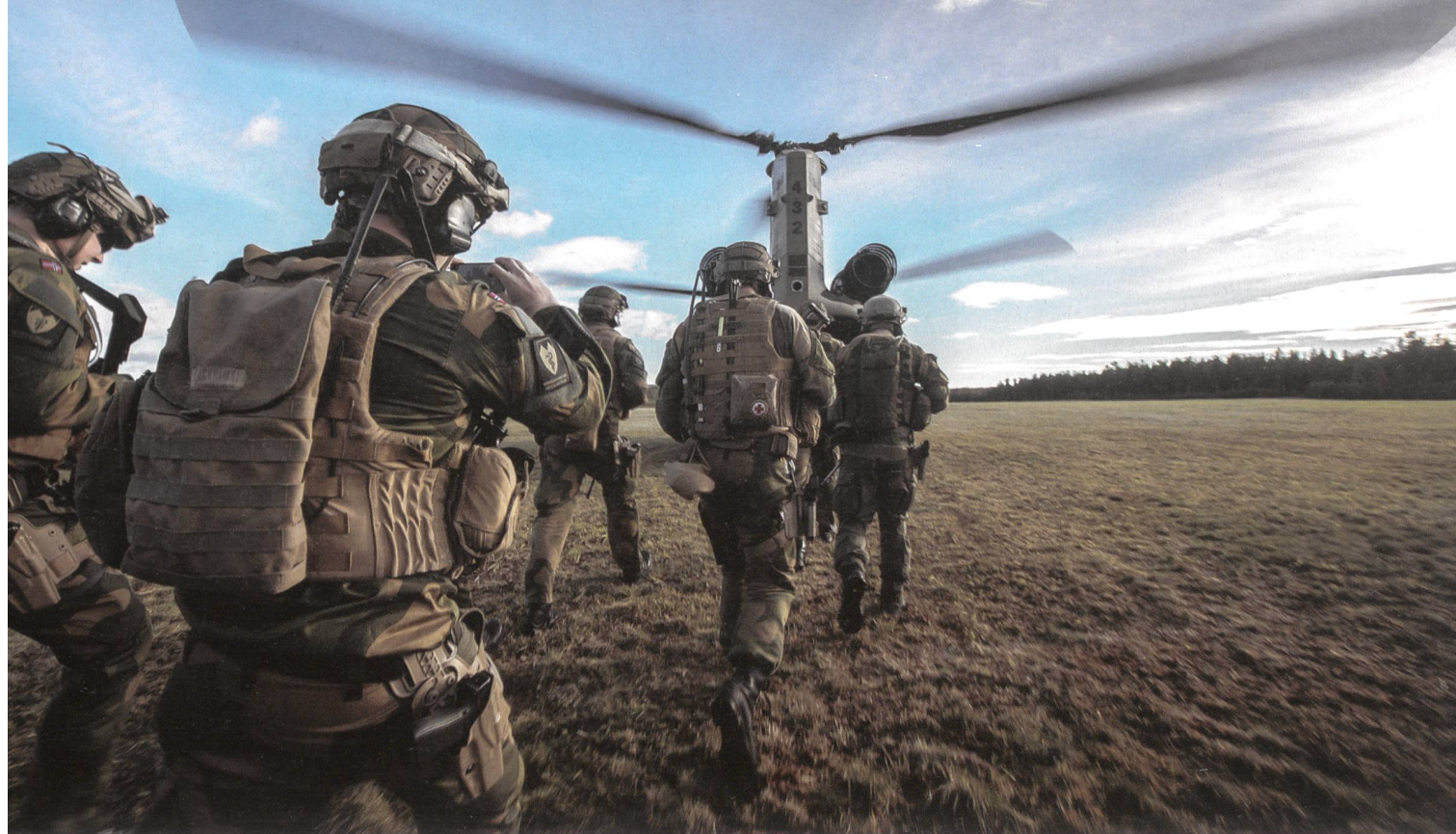
Norwegische Luftlandetruppen besteigen einen Heli CH-47 Chinook der US Army.