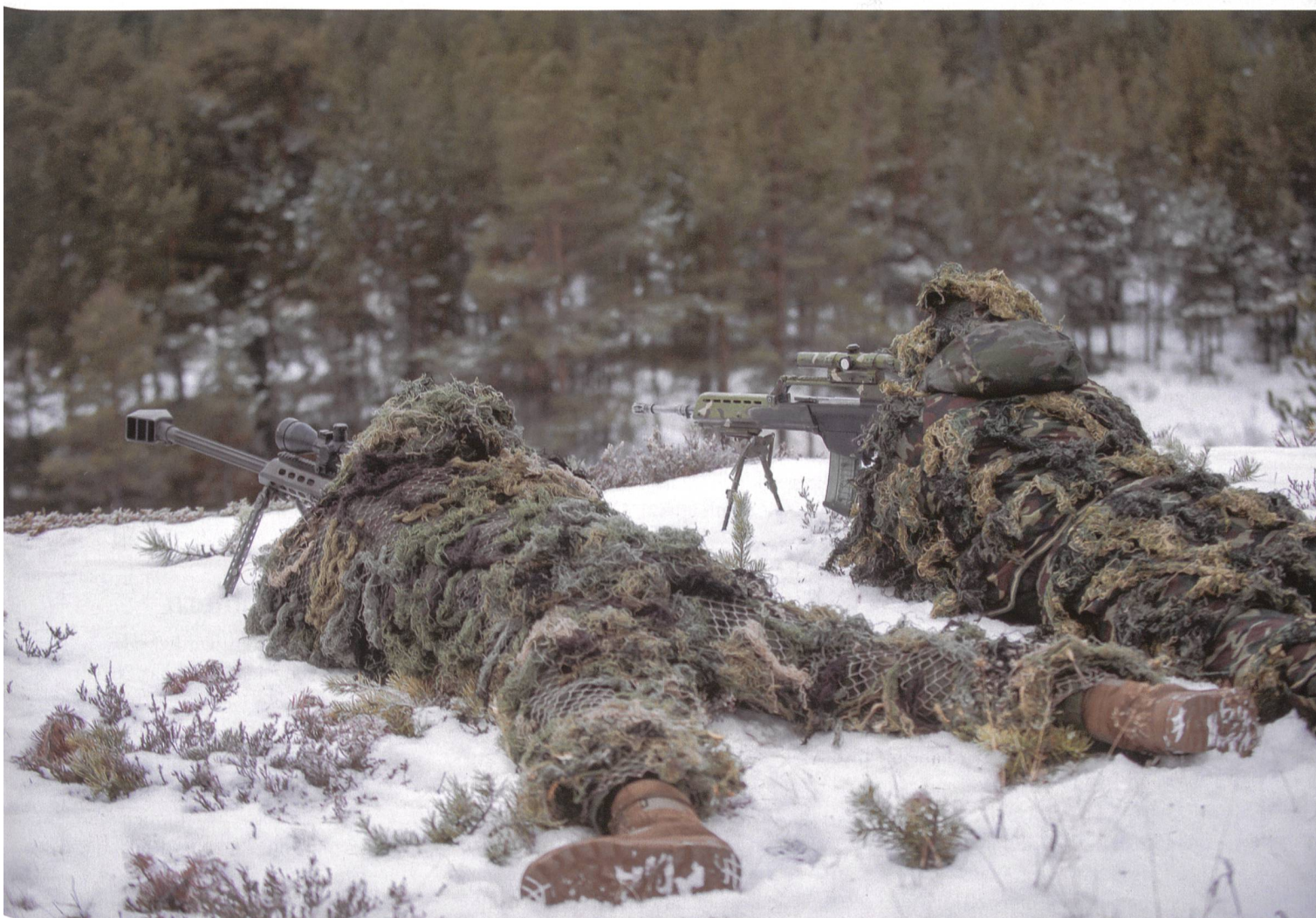
Ein spanischer Scharfschütze mit seinem Späher des Lepanto-Bataillons im tief verschneiten Norwegen