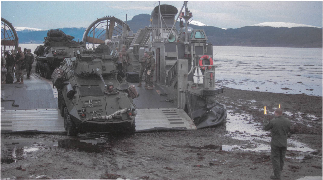
US Marines entladen bei Avlund Radschützenpanzer von einem Luftkissenfahrzeug (LCAC), das Material vom Docklandungsschiff USS New York (LPD 21) heranführt.

Zentralnorwegens von Bergen bis Tromsø, hin bis in Teile Schwedens und Finnlands. Und dies ab den norwegischen Flugplätzen von Andoya mit etwa 10 Flugzeugen, Bodö mit 60, Örland mit 20 und Gardemoen 10 sowie ab Rovaniemi in Finnland und Kallax in Schweden. Die eigentliche Gefechtsphase bestand aus zwei Teilen: