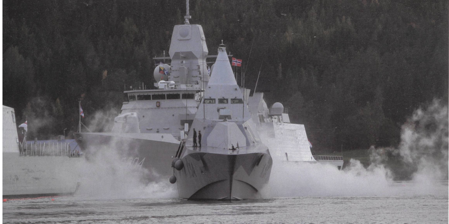
Die schwedische Stealth-Korvette Nyköping der Visby-Klasse verlässt den Hafen von Trondheim.

tive ergreifen und einen Gegenangriff in Richtung Norden durchführen.