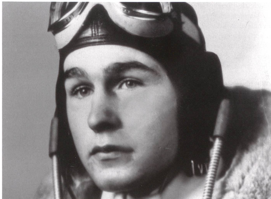
George H.W. Bush, vom Juni 1944 an der jüngste Marineflieger im Pazifikkrieg.