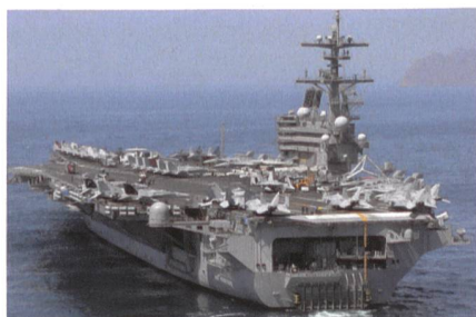
Träger USS George H.W. Bush, CVN-77.