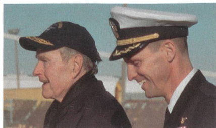
zeigt George H.W. Bush bei der Schiffstaufe.