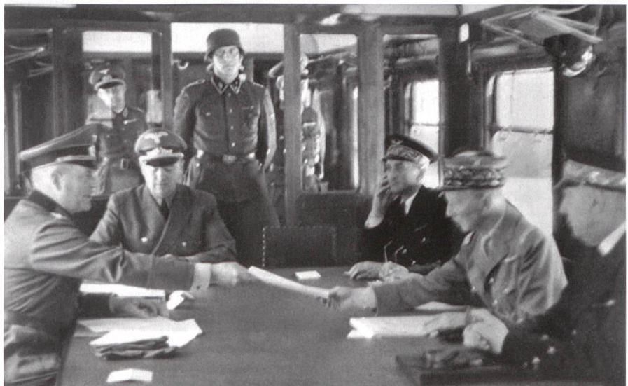
22. Juni 1940, im Salonwagen: Feldmarschall Keitel überreicht den geschlagenen Franzosen den Vertrag zum Waffenstillstand (unscharfes historisches Bild).