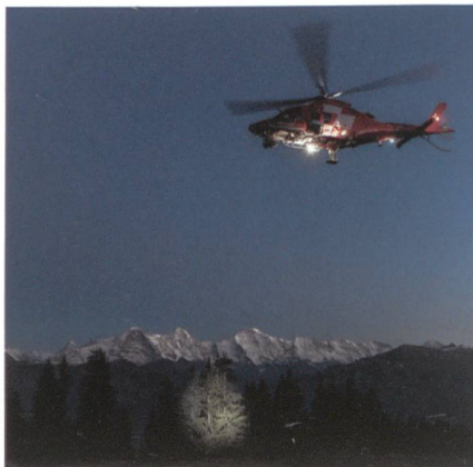
Rega-Helikopter sucht in der Nacht.

Die Wärmebildkamera erfasst kleinste Wärmeunterschiede und ermöglicht eine grossflächige, effiziente Suche nach Men- schen aus der Luft. rega.