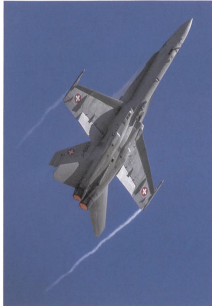
F/A-18-Bild von Marius Schenker: Displaypilot schraubt sich in den Himmel.

Aus Sicht der FDP sind Zweifel an der vom Bundesrat unterstrichenen «grossen Tragweite» des Planungsbeschlusses, der die zwei Rüstungsvorhaben NKF und