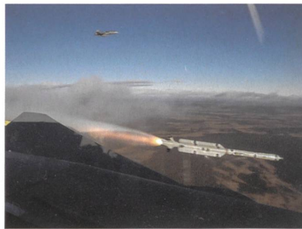
Der Gripen E 39-8 schießt Rakete ab.

zu beurteilen, wie sich das Flugzeug mit der zusätzlichen Last verhält. Dieser Test wurde auch verwendet, um die Auswir-