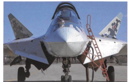
Potenzieller Gegner 2040: Suchoi-57.

Unzufrieden ist die SVP damit, wie wenig Geld der Bundesrat für die Erfüllung dieser staatlichen Kernaufgabe maxi-