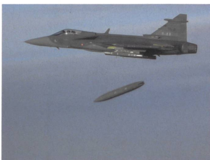
Gripen E und IRIS-T-Luft-Luft-Rakete.

Der Gripen E hat die ersten Tests zur Verifizierung der Fähigkeit, externe Nutzlasten abzuschliessen, erfolgreich abgeschlossen.