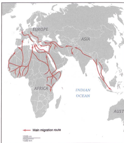
Migrationsrouten im Winter 2018/2019.

Dass die Linke daran interessiert ist, dass unser direktdemokratisches System zerstört wird, verwundert eigentlich keinen informierten Bürger. Dass aber angeblich