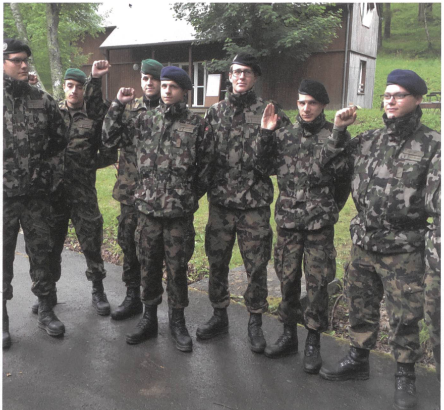
Ein Detachement von 50 Soldaten aus den RS vertrat die junge Generation.

Schon kündigt sich die 61. Internationale Militärwallfahrt an: Sie findet vom 16.-20. Mai 2019 statt.