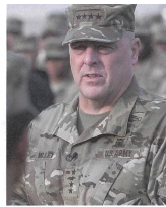
Der Heeresgeneral Milley.