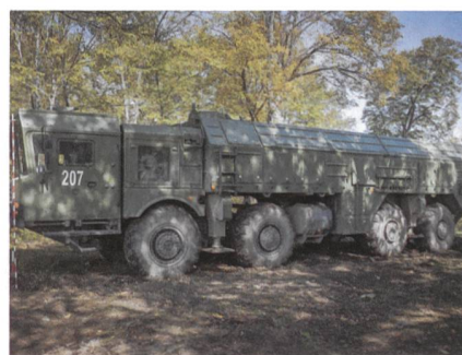
Das Trägerfahrzeug 207 gedeckt.