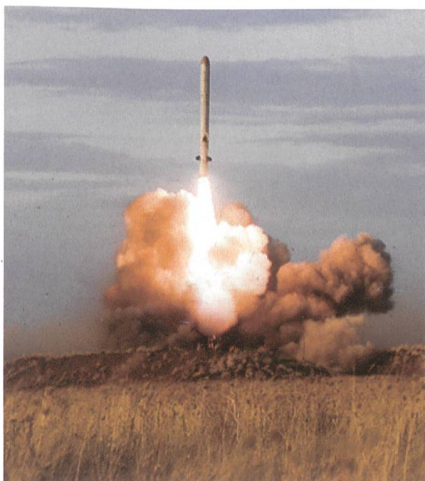
«WOSTOK»: Abschuss in der Steppe ...

Entweder AA-86 Nuklearsprengkopf mit einer variablen Sprengleistung von 5 bis 50 kT. Oder AA-92 Nuklearsprengkopf mit einer variablen Sprengleistung von 100 bis 200 kT.