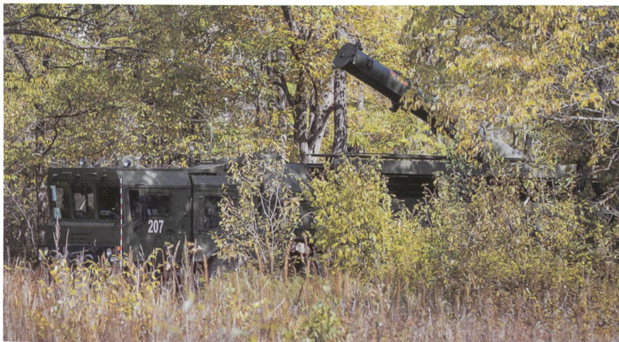
Selten gibt Russland Gefechtsbilder frei. Iskander-Stellung im Manöver.