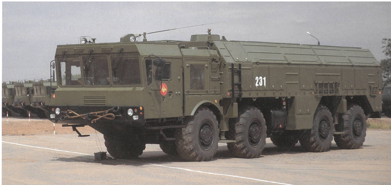
Alle Bilder wurden offiziell freigegeben

Die 9M728 und 9M729 sind auf dem geländegängigen MZKT-7930 untergebracht.