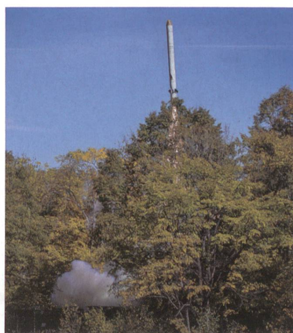
... und aus geschützter Waldstellung.