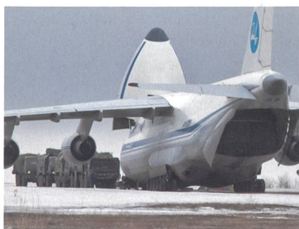
«WOSTOK»: Batterie vor Lufttransport.

Pavel Podvig, Chef der Nuklearrüstung, pflegt zu behaupten, die 9M729 unterscheidet sich von der 9M728 nur durch den grösseren Treibstofftank – womit er wohl scherzt, um INF nicht zu verletzen.