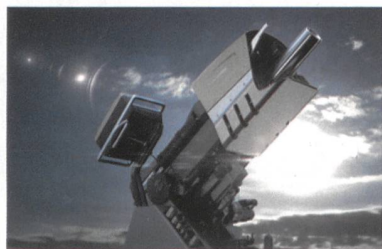
RUAG COBRA Mörsersystem

Das RUAG COBRA 120mm Mörsersystem ist ein Hightech-Produkt, das neue Massstäbe für indirekte Feuersysteme setzt. Ein elektrischer Antrieb und eine halbautomatische Ladevorrichtung sorgen für entscheidende Präzision und Schnelligkeit. RUAG COBRA kann einfach auf jedem Rad- oder Kettenfahrzeug montiert werden und ist so ausgelegt, dass die Nutzer das System schon nach kurzer Schulungsdauer versiert einsetzen können.