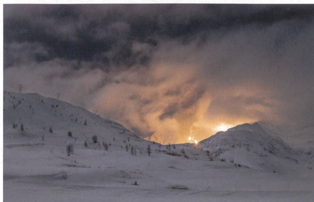
Nächtliches Beleuchtungsschiessen in den Walliser Alpen.