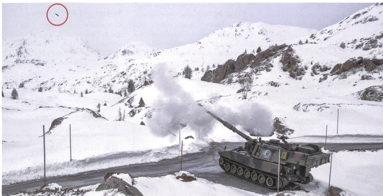
«Schuss ab!» – dieses Bild gelang Marius Schenker auf dem Schiessplatz Simplon. Links oben erkennbar die Granate.