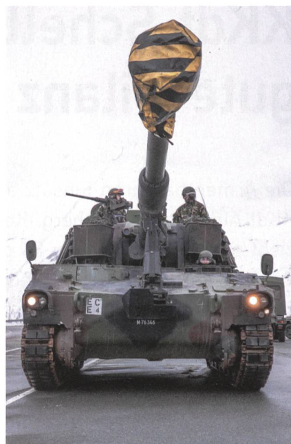
Die Hauptwaffe der Art Abt 49, die Pz Hb M-109 KAWEST, auf dem Simplon.