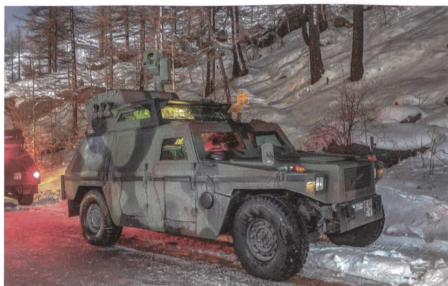
Das Aufklärungsfahrzeug 97: der bewährte Eagle (Mowag).