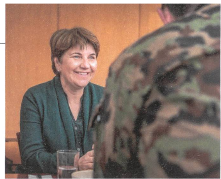
Bundesrätin Amherd: Guter Eindruck.

Das Besuchsprogramm führte auch in eine Stellung der Fliegerabwehr.