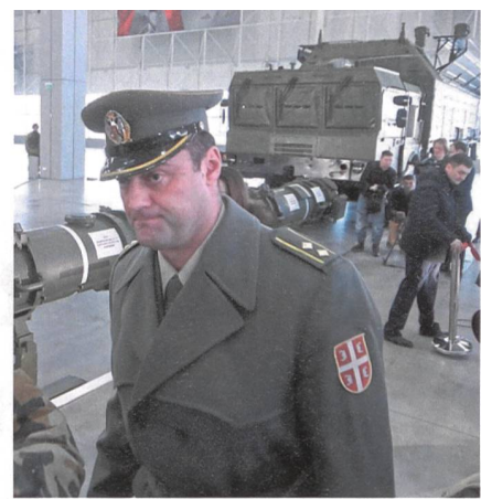
Der kritische serbische Attaché. Hinten das geländegängige Ladefahrzeug 9T250, basierend auf dem MZKT-7930.

Schon besitzt China mehr ballistische Raketen als die USA. Diese fürchten be-