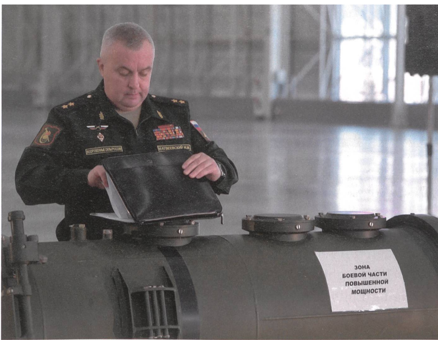
General Matvejevski mit der 9M729. War es die Waffe? Oder nur eine Röhre?

rium ohnehin nicht einsetzen konnten. Umgekehrt habe INF der Sowjetunion Waffen entzogen, die sie vom westlichen Vorfeld ihres Imperiums auf Distanzen über 500 Kilometer anwenden konnte.