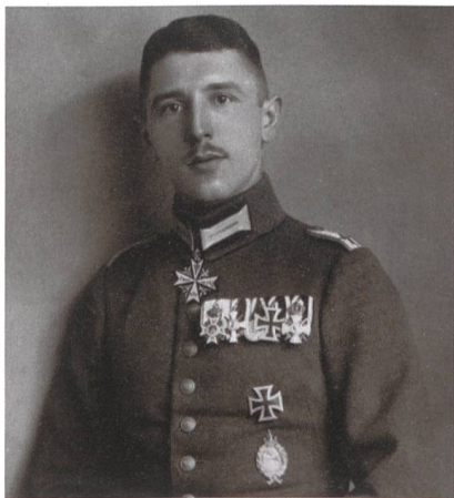
Max Immelmann (1890–1916).

Die Kunstflugfigur «Immelmann» ist nach dem Flieger-Ass Max Immelmann benannt wie auch das Taktische Luftwaffengeschwader 51 der Bundeswehr.