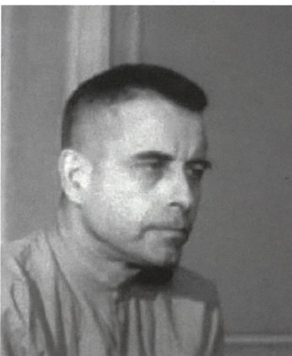
Der in Nordvietnam gefangene Fregattenkapitän Jeremiah Denton bei seinem TV-Interview, in dem er mit den Augen die Morsenachricht TORTURE (Folter) in die Kamera blinzelte; das historische Bild ist leicht unscharf.

Es war sein 12. Einsatz über Nordvietnam. Dabei wurde die Maschine von der Fliegerabwehr 120 km südlich von Hanoi