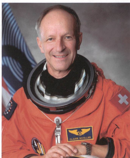
Als Astronaut legte der Major und Milizmilitärpilot Claude Nicollier im Weltall für unser Land Ehre ein.

Im Rahmen eines Abkommens zwischen ESA und NASA erhielt er am Johnson Space Center der NASA in Houston eine umfassende Ausbildung auf der amerikanischen Raumfähre Space Shuttle. Nach mehreren Jahren in Houston, in denen er nebst seiner Ausbildung verschiedenste Aufgaben übernahm, nahm er zwi-