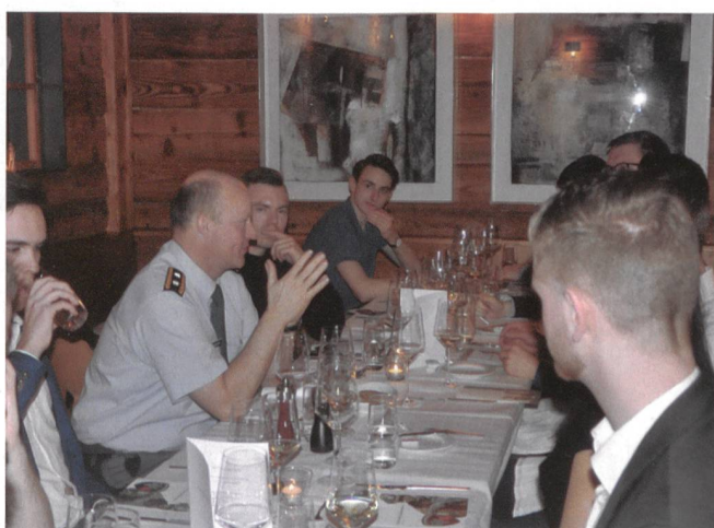
Spannende Diskussion im Restaurant Candela, St. Gallen.