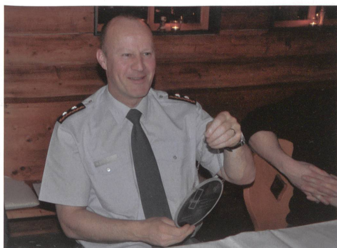
Die Wappenscheibe der HSG-Offiziere für Div Brülisauer.