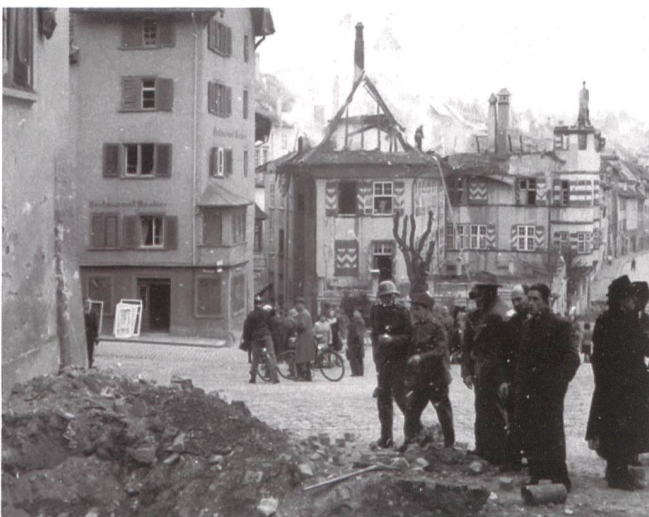
Wehrmänner und Zivilpersonen in den Trümmern.