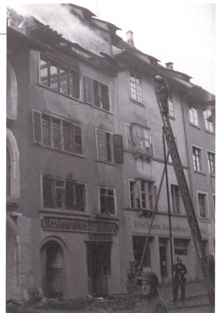
Die Feuerwehr – vorne ein Soldat.