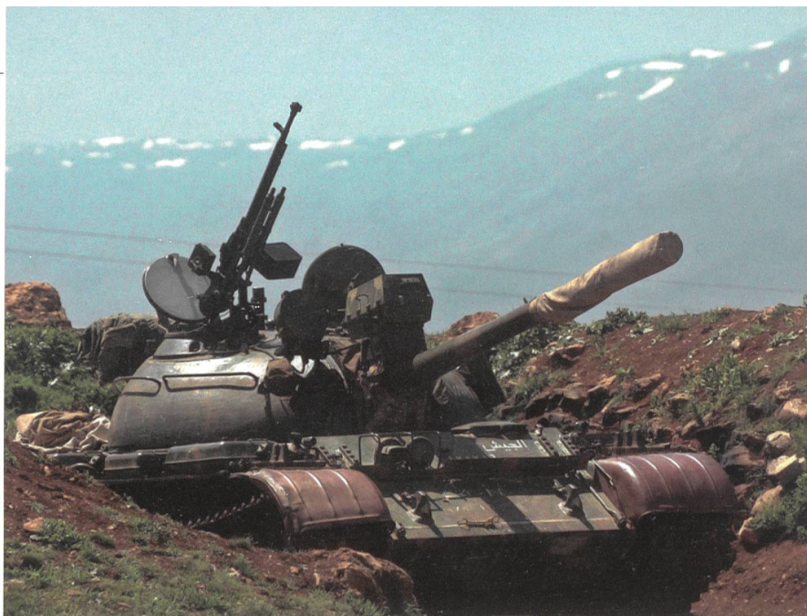
Syrien: T-55 am Fuss des Hermon. Grün, die Schutzbleche braun. Die Mündungsbremse vorne kennzeichnet den T-55 (ein weiteres Merkmal wäre das Fahrwerk).

In allen israelischen Brigade- und Bataillonsstäben dienten Nachrichtenoffiziere, deren Familien aus arabischen Ländern