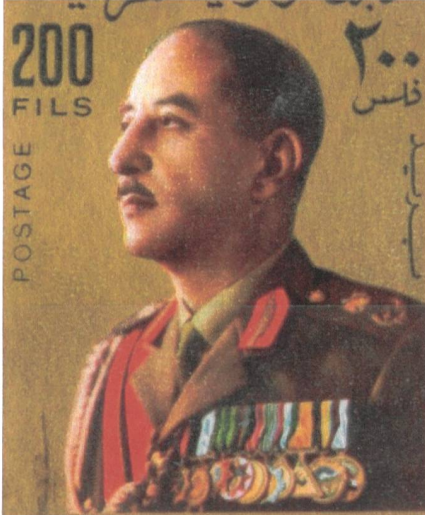
Iraks Präsident und General al-Bakr (historisches Bild auf Briefmarke).

kische Angriffsspitze war eingeschlossen und dem Untergang geweiht.