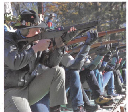
Schweizer Schützentraktion: Rütli-schiessen am Mittwoch vor Martini.

Man stelle sich vor, die Situation in Venezuela mit der Unzufriedenheit des