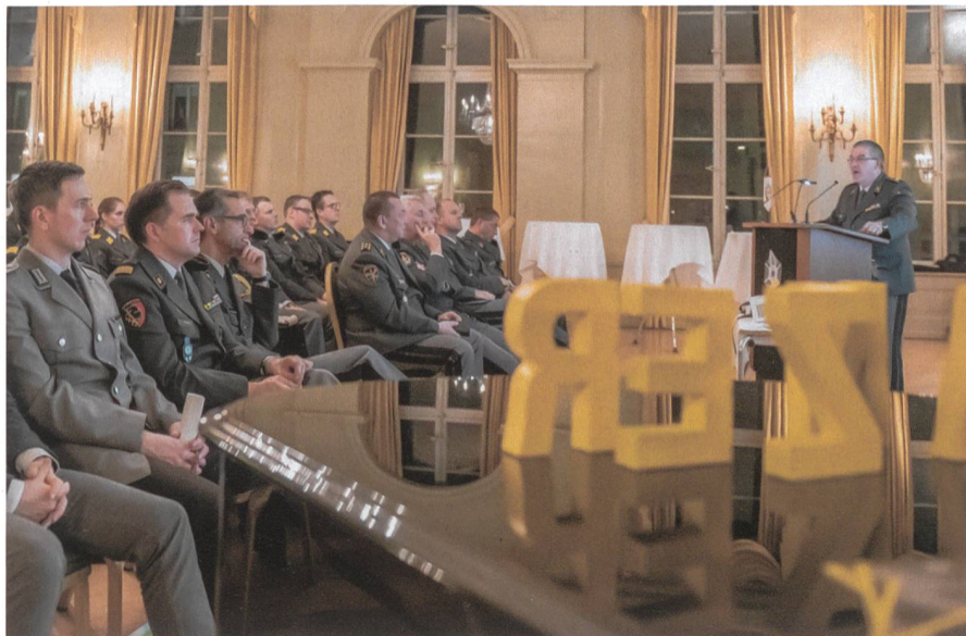
Brigadier Metzler beim packenden Referat über seinen Lehrverband.

Der Ausblick auf Vereinsanlässe lässt aufhorchen: Kadertische sind vorgesehen. Die Tagung im Herbst zur Zukunft der Panzer und die 200-Jahre-Feier Waffenplatz Thun bilden weitere Höhepunkte.