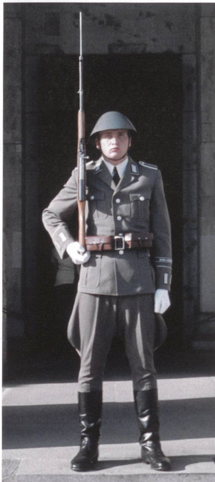
NVA-Posten in Ostberlin, August 1975, vor dem damaligen «Denkmal für die Opfer des Faschismus», heute wieder «Neue Wache».