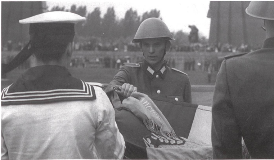
Fahneid. Man beachte den für die NVA typischen Stahlhelm.

Volksarmee nicht geweigert hätten, die Armee zur Abschreckung der Demonstranten einzusetzen, wie es Staats- und Parteichef Erich Honecker gefordert hatte.