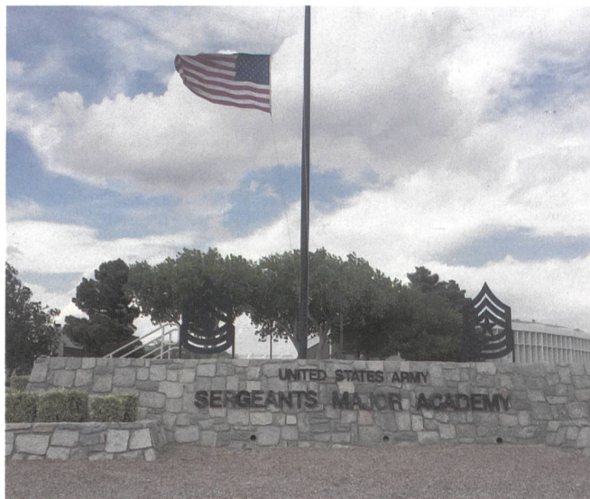
Die United States Army Sergeants Major Academy in Texas.