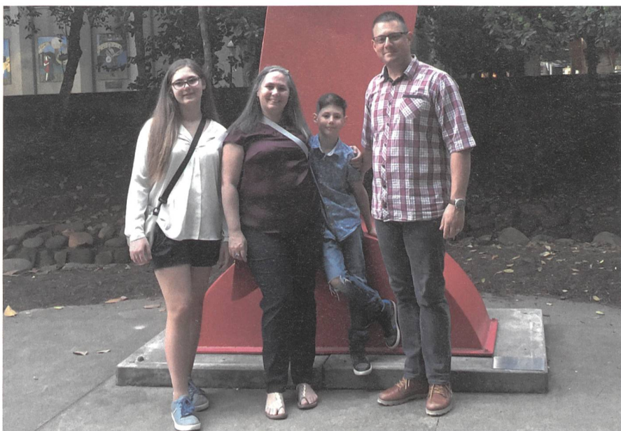
Familie Emonet unterwegs in den USA.

Die Verheissung eines Aufenthalts in den USA war stets vor unseren Augen und in unseren Gedanken obwohl wir uns bewusst waren, dass noch nichts abschliessend entschieden war.