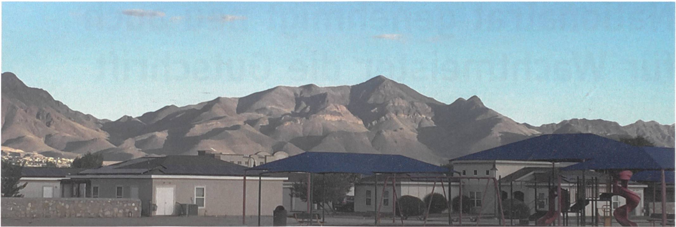
Unser neuer Horizont in Texas.

gliederungsprozesses. Gegen das Wetter konnten jedoch auch sie nichts ausrichten.