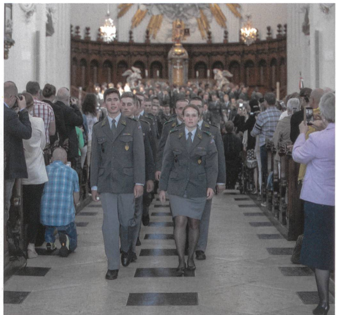
Der Ausmarsch der neuen Zugführer aus der Kathedrale.