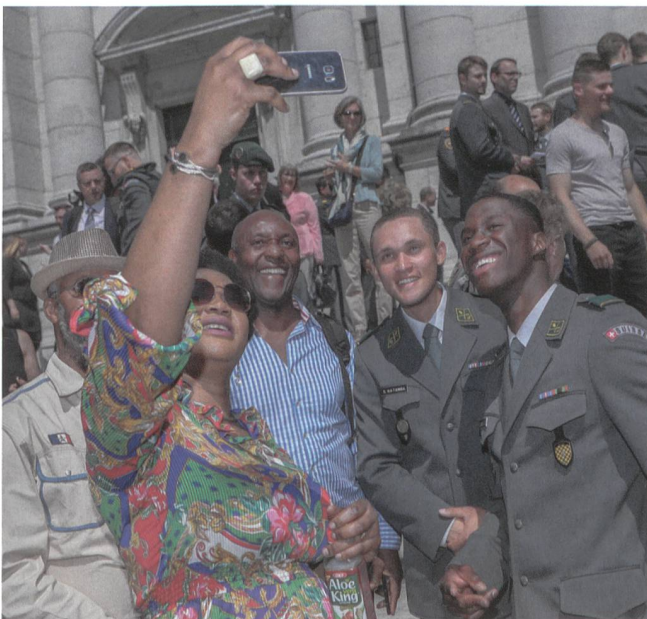
Nach der Feier gilt auch in Solothurn: Freude herrscht!