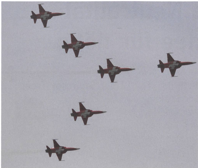
Die Patrouille Suisse über Emmen.