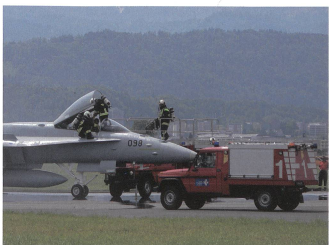
Ein F/A-18 und die Feuerwehr – ein seltenes Bild.