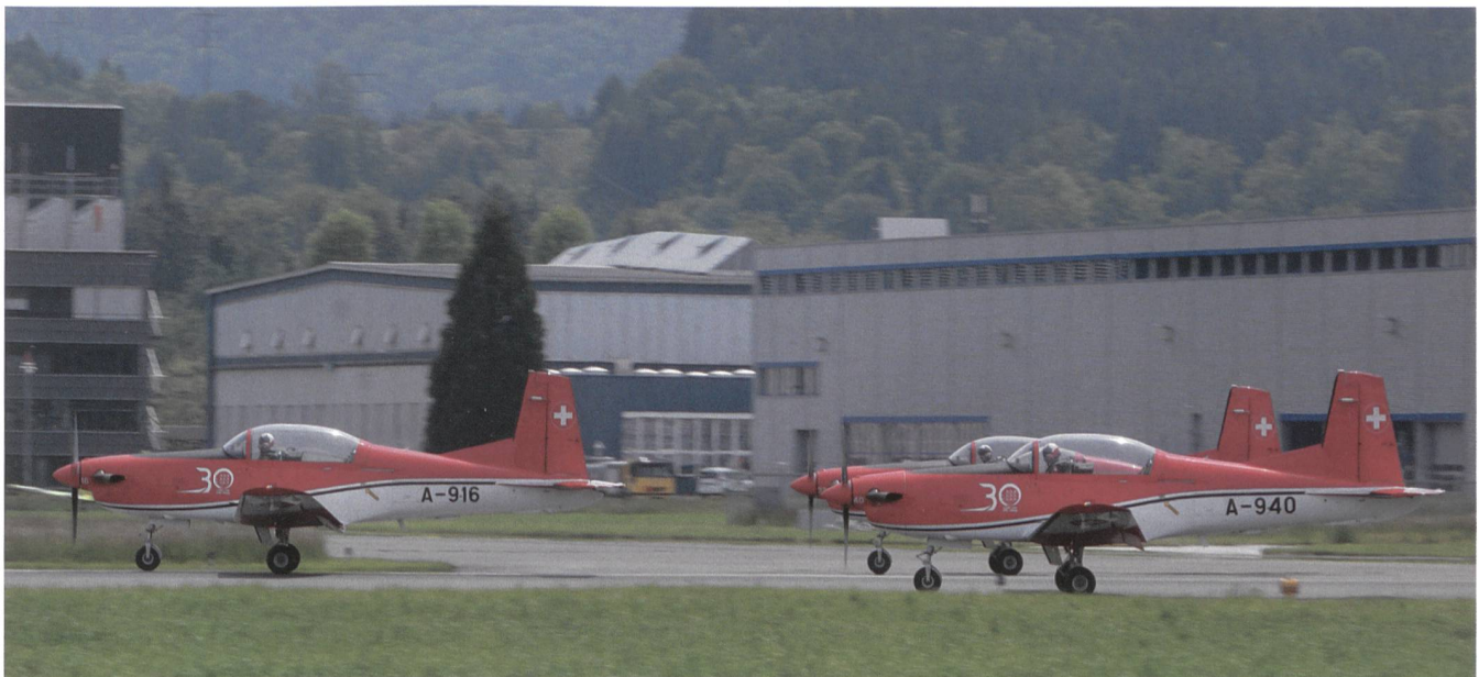
Das PC-7-Team. Die Zahl 30 stammt von seinem runden Geburtstag.