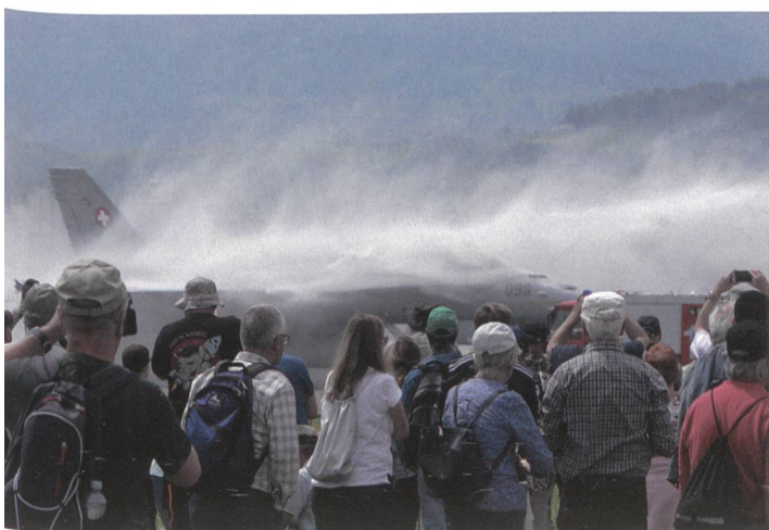
Aufmarsch zur Feuerwehr-Präsentation an einem F/A-18.