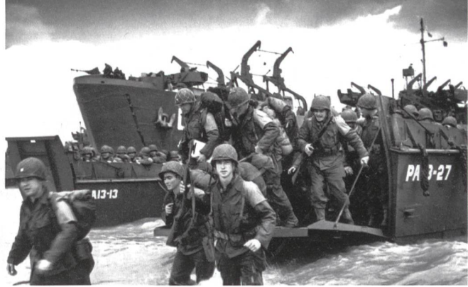
«D-Day»: Amerikaner gehen an Land.