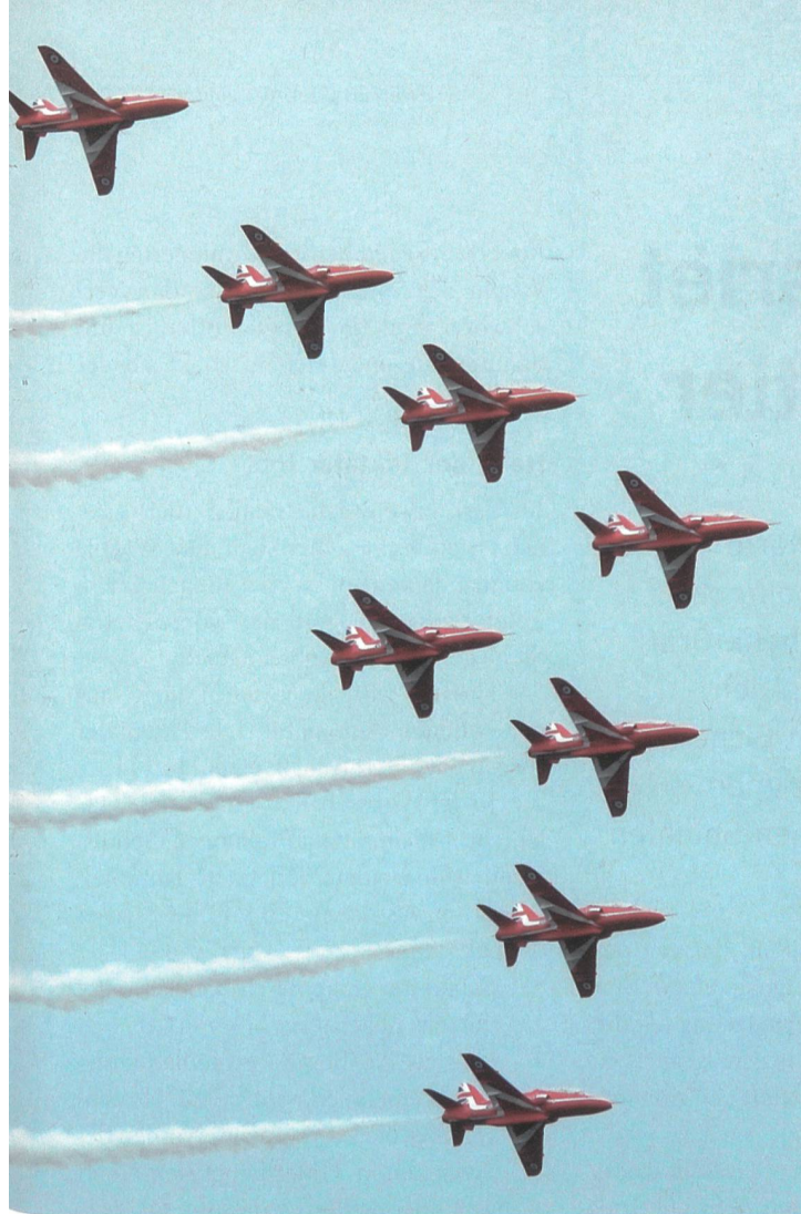
Die britischen Red Arrows ehren die Veteranen.