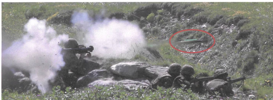
Wichlen: Das Ostschweizer Inf Bat 61 trainiert im scharfen Schuss – Seiten 18-19.