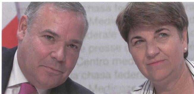
Gaudin mit der Chefin, Bundesrätin Amherd. Viola Amherd und Jean-Philippe Gaudin waren im Bundesrat erfolgreich.