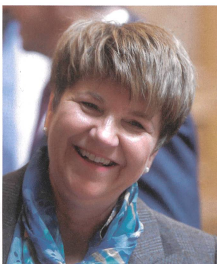
Viola Amherd: Die Armee muss auf die Veränderung der Bedrohung reagieren.

Gerade die Beschaffung von Kampfflugzeugen wird immer heftig diskutiert.