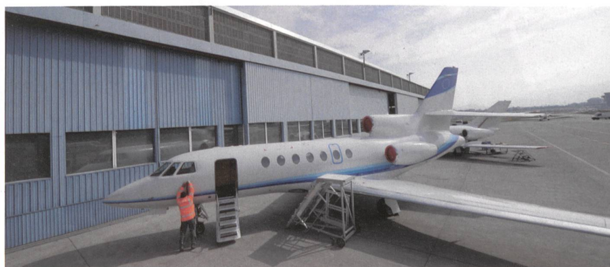
Der Standort Genf-Cointrin.