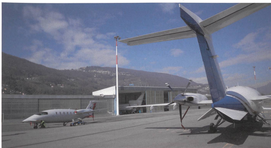
Der Standort Lugano-Agno.

RUAG verkauft als Folge der neuen strategischen Ausrichtung die beiden auf Business Jets spezialisierten Standorte an den Flughäfen Genf-Cointrin und Lugano-Agno. Käufer ist Dassault Aviation. Der neue Eigentümer übernimmt alle 87 Mitarbeiter. Der Verkauf der RUAG Business Aviation AG ist der erste Schritt bei der Neuausrichtung des Portfolios von RUAG.