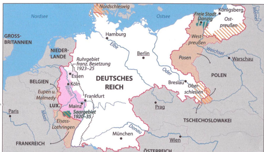
Versailles 1919: Das deutsche Reich verliert 13% Fläche und 10% Bevölkerung.