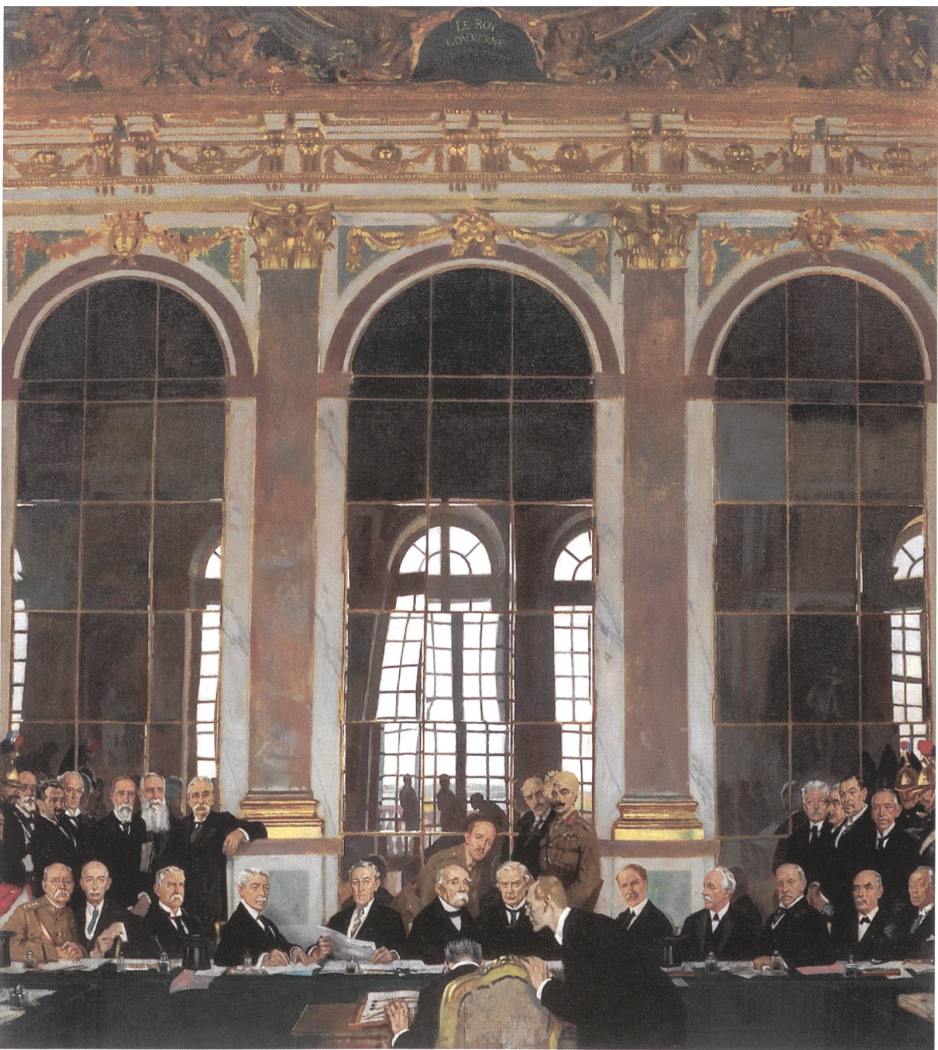
28. Juni 1919, Versailles. Vertragsunterzeichnung im Spiegelsaal, in dem Wilhelm I. 1871 das Kaiserreich ausgerufen hatte. Mitte mit Schnauz Clemenceau zwischen Wilson und Lloyd George. Davor die dt. Minister Bell und Müller. Oben der Spruch, den noch Louis Quatorze, der Sonnenkönig, anbrachte: «Le roi gouverne par lui-même», der König regiert durch sich selbst.