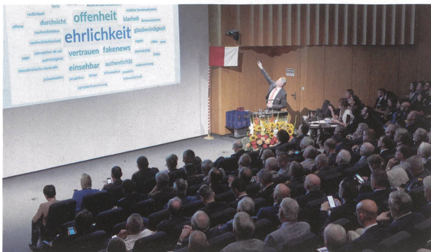
Gut besucht: Herbsttagung 2019.

Der Armee bieten sich Chancen die Jugendliche über diese Kanäle zu erreichen und im Gespräch zu bleiben. Am Ende der Herbsttagung war klar: Wenn jemand Chancen nutzt, dann die MILAK! Die Organisatoren haben erneut ein gutes Gespür bewiesen und eine spannende Vortragsreihe mit Diskussionsrunde organisiert.