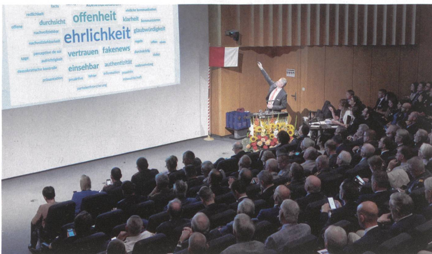
Gut besucht: Herbsttagung 2019.

Der Armee bieten sich Chancen die Jugendliche über diese Kanäle zu erreichen und im Gespräch zu bleiben. Am Ende der Herbsttagung war klar: Wenn jemand Chancen nutzt, dann die MILAK! Die Organisatoren haben erneut ein gutes Gespür bewiesen und eine spannende Vortragsreihe mit Diskussionsrunde organisiert.