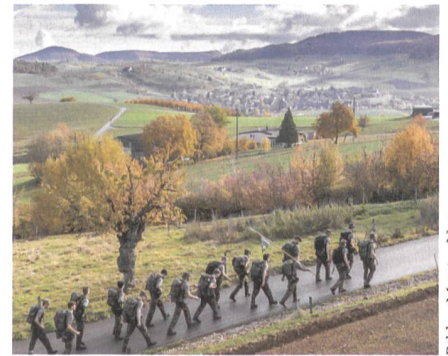
Bilder: Mattias Nutt