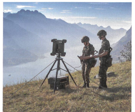
Silbergrau: Übermittlungs- und Führungsunterstützungstruppen