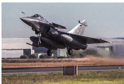
Abflug eines Rafale in Richtung Indien.

Laut Dassault sind die ersten fünf für Indien bestimmten Rafale Kampfflugzeuge nach Indien geliefert worden. Indien hat im Frühjahr 2015 nach jahrelangem Hin und Her 36 Rafale Kampffjets von Dassault gekauft, ursprünglich wollte man 126 Maschinen dieses Hochleistungsjet beschaffen und einen grossen Teil davon auf einer Endfertigungsstrasse in Indien produzieren. Zu diesem Grossauftrag kam es jedoch nicht, dafür hat sich Indiens Luftwaffe zum Kauf von 36 fabrikneuen Rafale Kampffjets aus den Fertigungshallen von