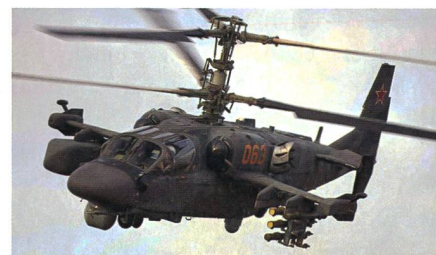
Erfolgreicher Erstflug der Ka-52M.