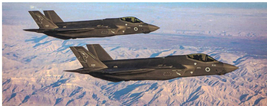
Zweites israelisches F-35-Geschwader einsatzbereit.

Nach sechs Monaten Vorbereitung hat die israelische Luftwaffe das zweite mit F-35I ausgerüstete Geschwader für einsatzbereit erklärt. Die «Löwen des Südens», so der Name des 116. Einsatzgeschwaders, starten mit dem Stealth Fighter ab sofort in den operativen Alltag. Als zweites Einsatzgeschwader in Israel machten sie sich mit dem neuen Stealth Fighter aus den USA vertraut, der in Israel «Adir» genannt wird: der Mächtige. Mächtig waren auch die