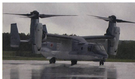
Japan als erster Exportkunde der V-22 Osprey.

Boeing hat am 10. Juli 2020 das erste Kipp rotorflugzeug vom Typ Bell Boeing V-22 Osprey an Japan übergeben, Japan wird damit nach den USA zu dem zweiten Osprey Betreiber. Die erste V-22 Osprey wurde per Schiff aus den USA auf die Ma-