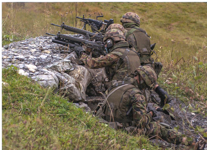
Panzergrenadiere im Gefecht.