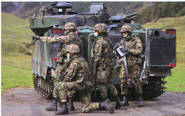
Der Gruppenführer bei der Befehlsausgabe.

offenhalten kann. Dabei müssen die Soldaten sowohl gepanzerte Gegner wie auch gegnerische Infanterie bekämpfen. Die Truppe wird dabei so nahe wie möglich mit dem Schützenpanzer transportiert und dringt dann abgesessen in die gegnerische Stellung ein.