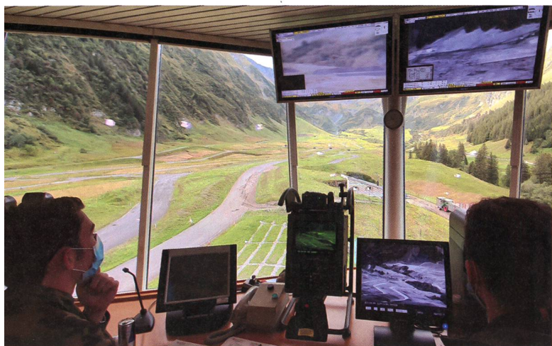
Alles im Überblick: Im Übungsleitstand.