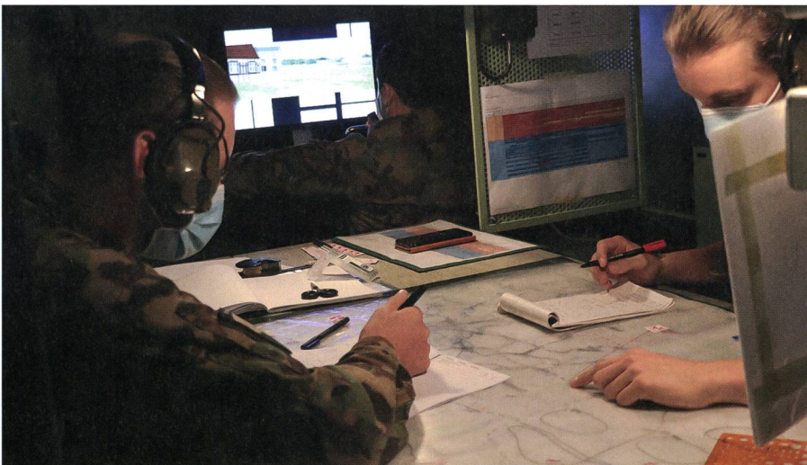
Im Führungsfahrzeug eines Kompaniekommandanten.