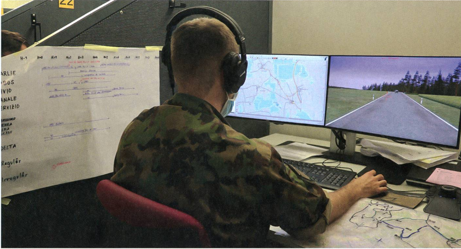
Digital und Analog: Zugführer am Arbeitsplatz.